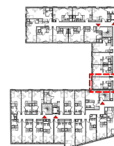
Plan de repérage / niveau 3